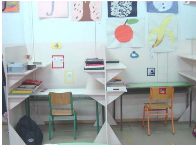
Zdjęcie 1: Samodzielne stanowiska pracy (dla dwojga uczniów z autyzmem)