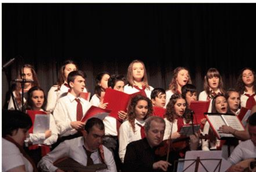
Figure 4. Des musiciens