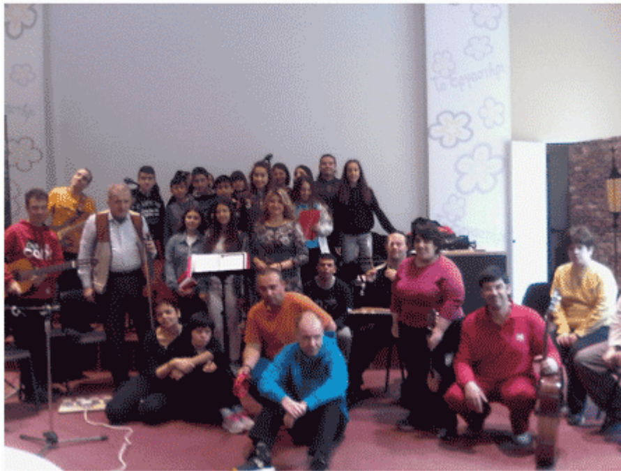
Figure 2. L'orchestre "Ichochroma"