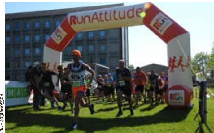
Pour attirer un autre public, des événements sont organisés dans l'événement comme le trail.

Enfin, les élèves de la 4 e PH proposaient une vente de condiments en barquette pour financer leur séjour nature et aventure à Wanne. Une idée